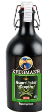
Kräuter-Spirituose 32%vol · 0,5l