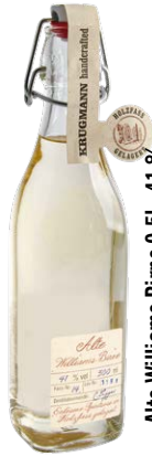
Alte Williams Birne 0,5l · 41 %