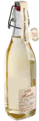
Alte Marille 0,5l · 41 %

Fassgereifte Brände meisterhaft verfeinert!