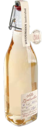
Alte Zwetschke 0,5l · 41 %