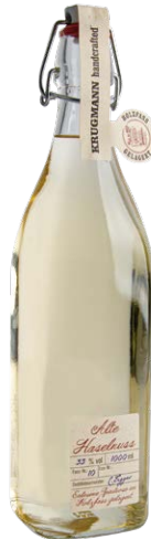
Alte Haselnuss 1,0l · 33 %

Fassgereifte Brände meisterhaft verfeinert!