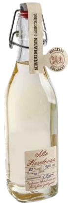
Alte Haselnuss 0,5l · 33 %