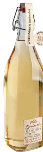
Alte Zwetschke 1,0l · 41 %