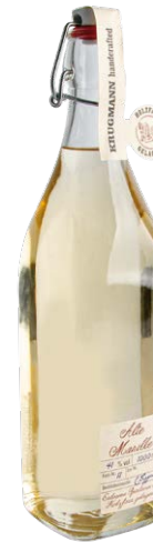
Alte Marille 1,0l · 41 %

Tel.: 02354 9159 - 0 · Fax: 02354 9159 - 30